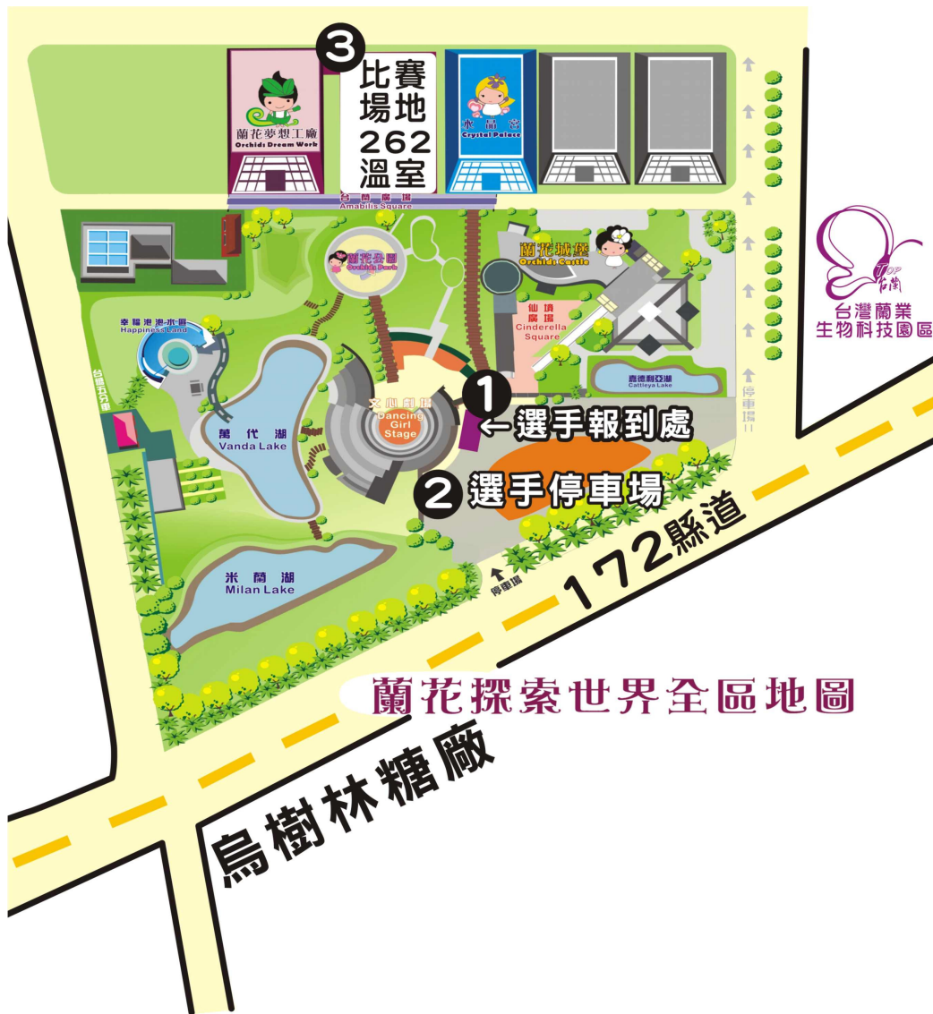
蘭花探索世界全區地圖